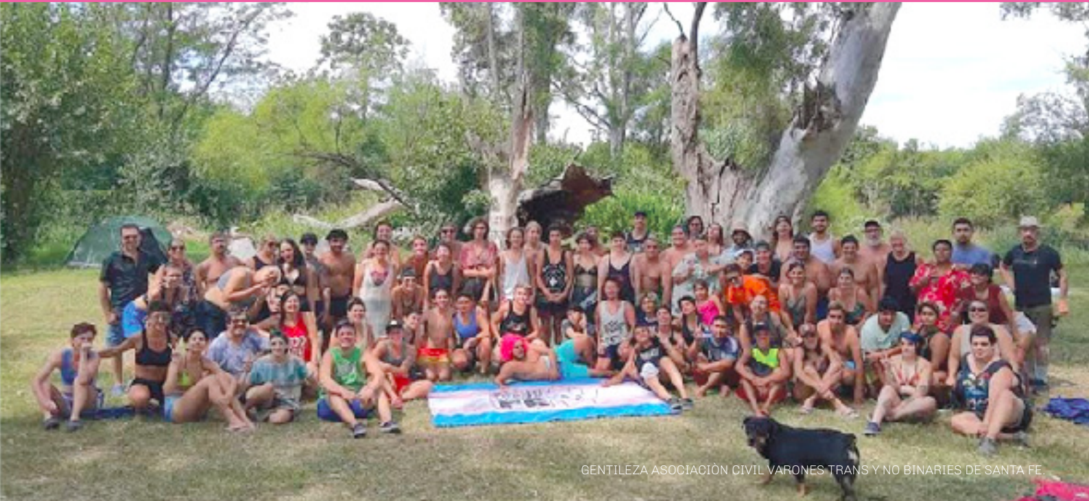
GENTILEZA ASOCIACIÓN CIVIL VARONES TRANS Y NO BINARIOS DE SANTA FE.

La mayoría de los integrantes de la agrupación son jóvenes y adolescentes de Rosario y de ciudades aledañas, aquí juntos en un encuentro de verano.