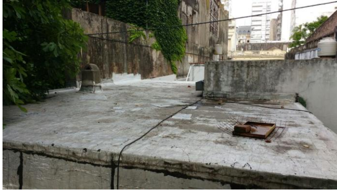
Cubierta 2- 14/12/2017