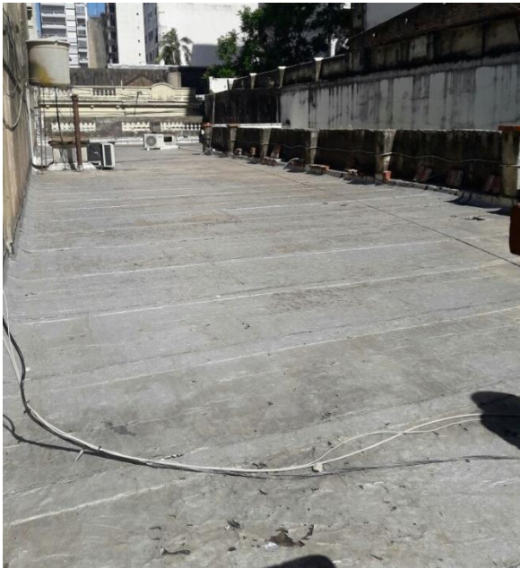
Cubierta 1 - 14/12/2017

A manera de introducción se incluyen fotos de las áreas objeto de la presente contratación.