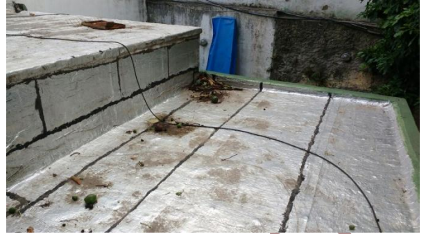
Cubierta 3 - 14/12/2017