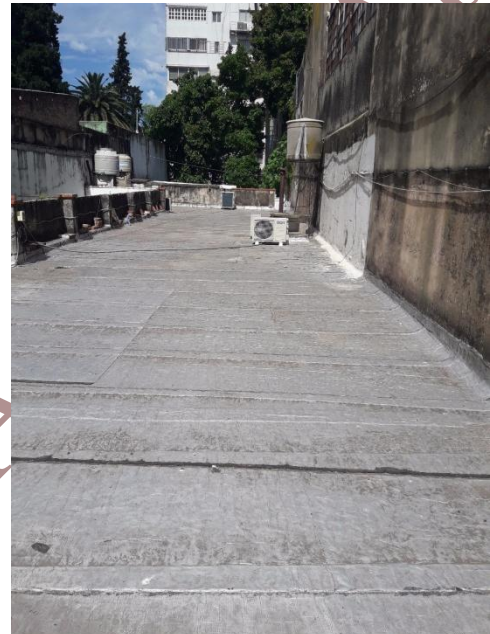
Cubierta 1 - 14/12/2017