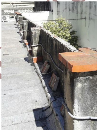
Cubierta 1- parapeto- 14/12/2017