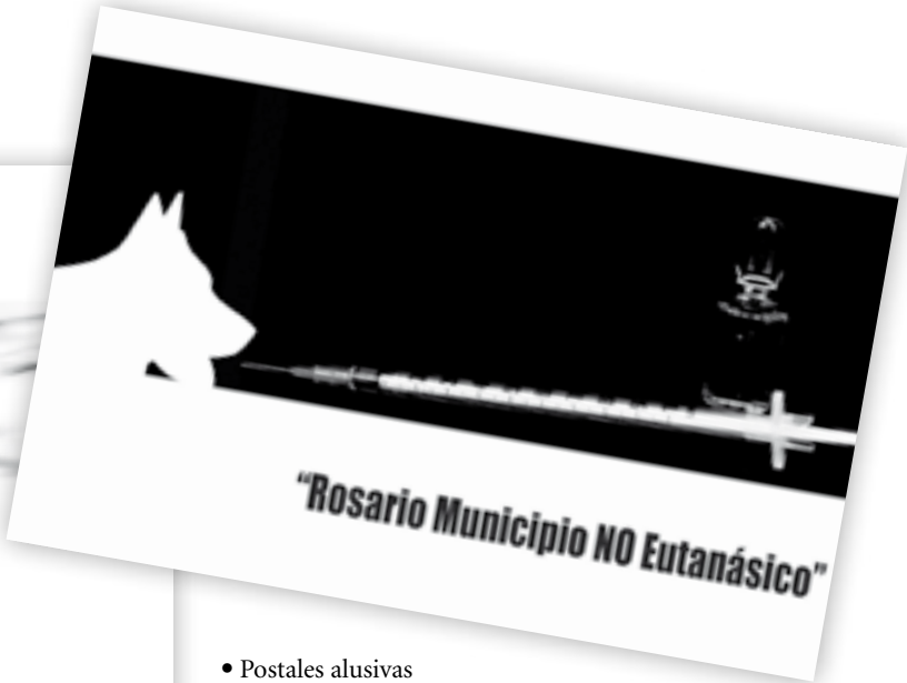
• Postales alusivas "Rosario Municipio NO Eutanásico"

6. Causar la muerte de animales grávidos cuando tal estado es patente en el animal y salvo el caso de las industrias legalmente establecidas que se fundan sobre la explotación del nonato.